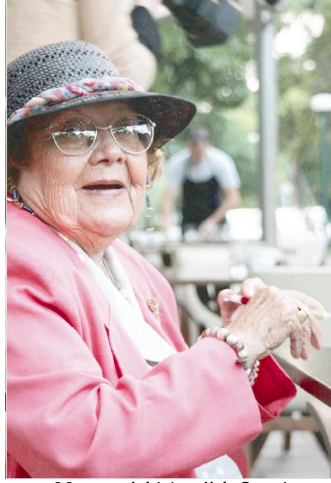
90 yaşındaki Atatürk Genci Muazzez İlimiye